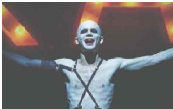
"קברט". הצלחה