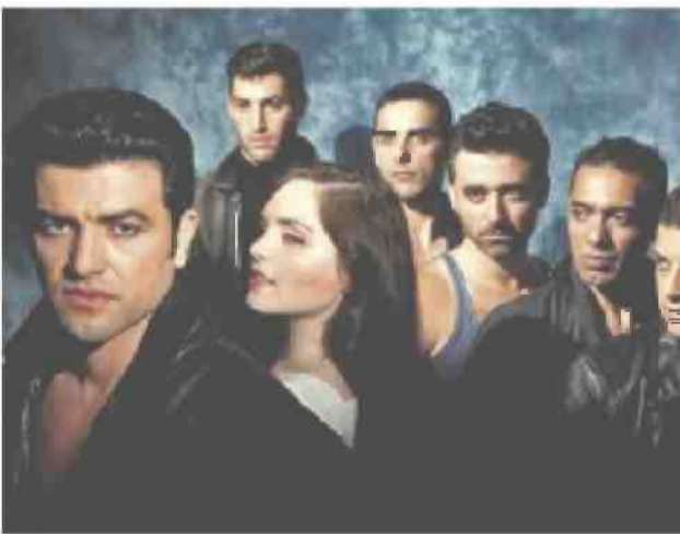
מתוך "קזבלן" שיעלה בקאמרי. מתגאים ברכש