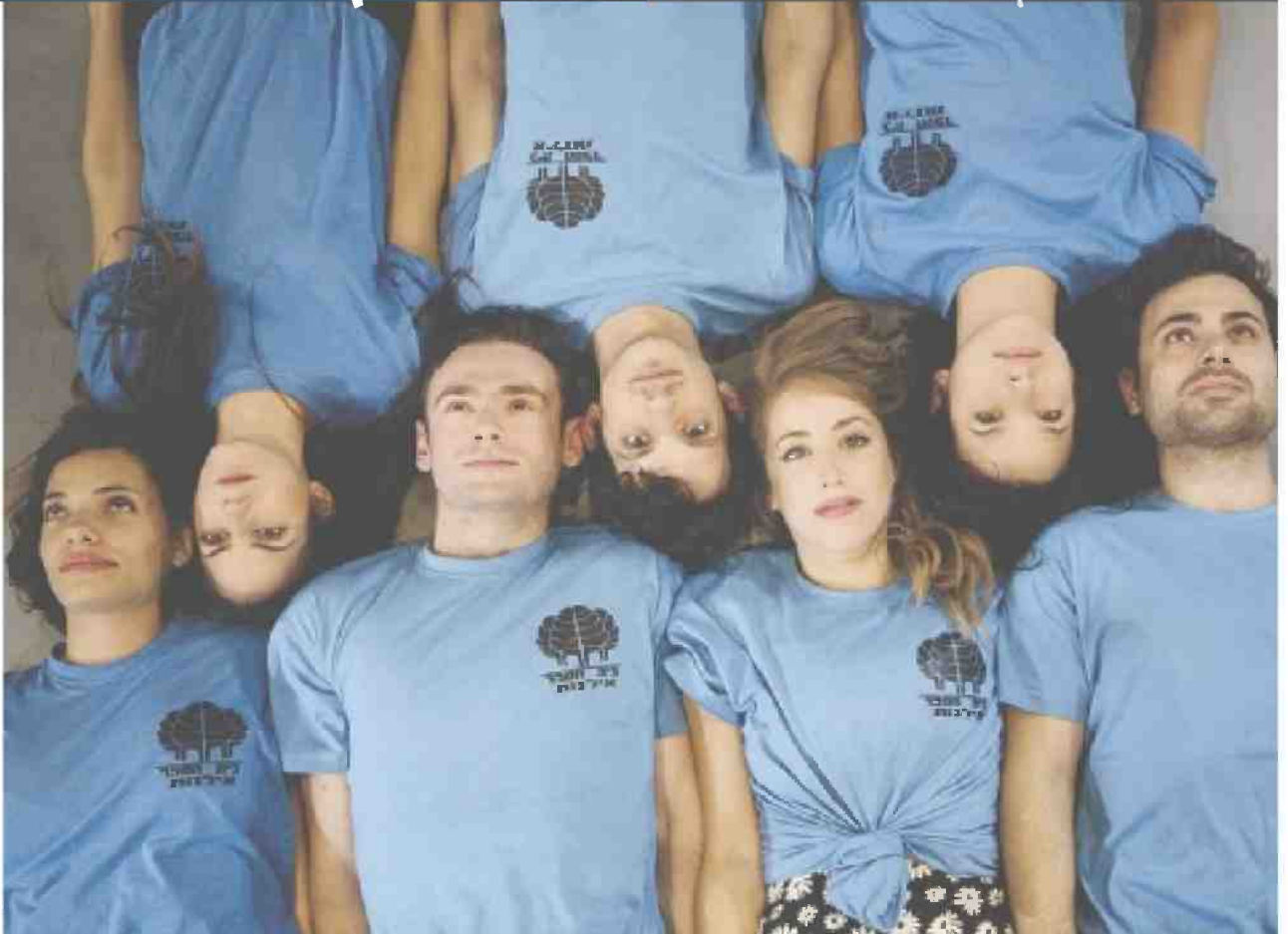
מתוך "שרוליק" שיעלה בקאמרי. מעגליות אינסופיות של מלחמות