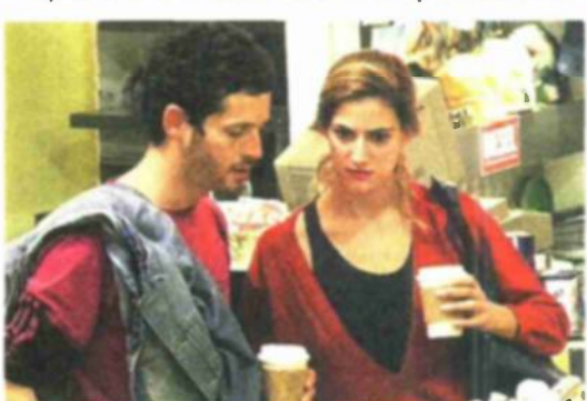
"כל כך פינק אותי". עם האקס, יאיר גפני