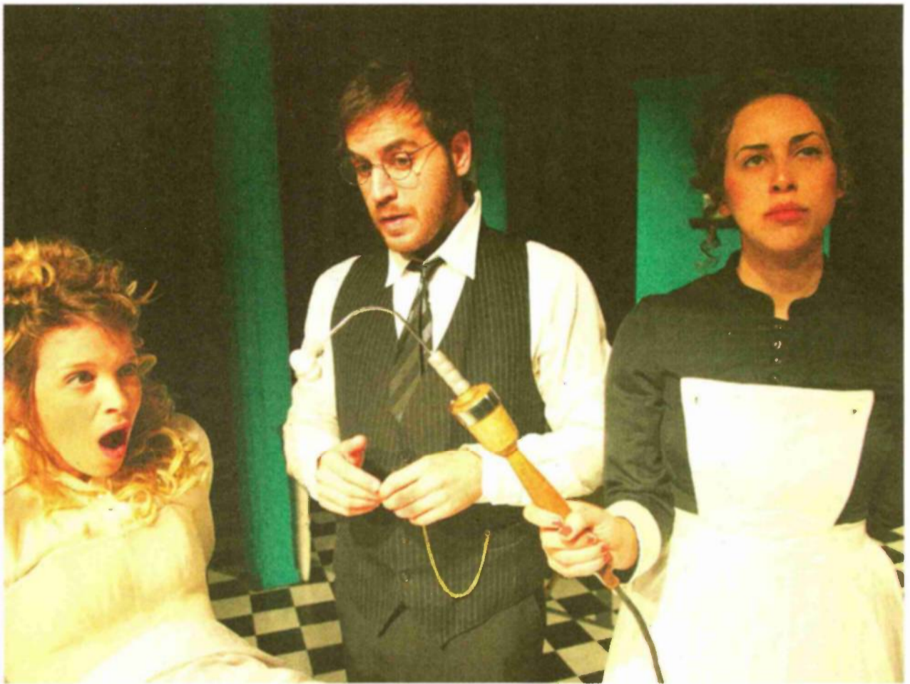
מתוך ההצגה. "לקחו מהנשים את ההנאה ממין, כי היא פשוט לא הייתה אלגנטית מספיק לתקופה"

צריכה זין, מתכוונים לזה שהיא צריכה להירגע ולהפסיק להטריד את הסביבה". הייתה לוויברטור כזאת משמעות בהיסטוריה? ארוז: "הוויברטור הוליד מודעות להנאה ולחוויה אינטימית". ברמן: "את רוב המהפכות הפמיניסטיות ליוו חידושים טכנולוגיים במיניות, כמו המצאת הג'וליה בשנות ה-60". ארוז: "נכון, הגלולה, וגם החזייה. אנחנו לא מבינים אפילו כמה חופש הרברים האלה נתנו לנשים". איך המחזה הזה רלוונטי ליהם לנשים בישראל 2012?